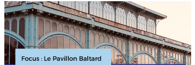
Focus : Le Pavillon Baltard

Engager des expérimentations concertées sur la piétonisation du centre-ville en soutenant le commerce local